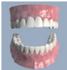
Die laborgefertigte Krone wird aufgesetzt – die Zahnreihe ist wieder geschlossen

• Dann wird darauf Ihre dauerhafte neue Zahnkrone befestigt. Sie haben den Komfort eines festsitzenden Zahnersatzes. Er kommt dem natürlichen Zahn im Aussehen so nahe, dass er von den Nachbarzähnen nicht zu unterscheiden ist.