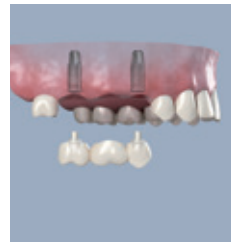
Zwei Implantate werden als Brückenpfeiler eingesetzt

• Lösung 1: Eine elegante Lösung ist Zahnersatz auf einzelnen Implantaten. Jeder Zahn wird ersetzt, so dass die ursprüngliche Situation wieder exakt hergestellt wird.