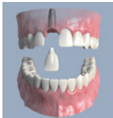
Das Implantat wird vorbereitet zur Aufnahme des Implantataufbaus

• Ein einzelner Zahn kann schnell verloren gehen, etwa bei einem Unfall. Sehr unangenehm, aber die entstandene Lücke kann mit einem Implantat ästhetisch geschlossen werden. Vor allem im Frontzahnbereich muss die Optik perfekt stimmen.