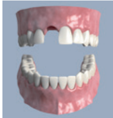
Einzelzahnlücke: Ein fehlender Schneidezahn

• Ein einzelner Zahn kann schnell verloren gehen, etwa bei einem Unfall. Sehr unangenehm, aber die entstandene Lücke kann mit einem Implantat ästhetisch geschlossen werden. Vor allem im Frontzahnbereich muss die Optik perfekt stimmen.