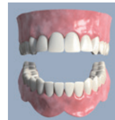
Vergleichbar mit dem Druckknopf-Prinzip wird die herausnehmbare Prothese auf zwei Locator-Aufbauten eingegliedert

• Auch im zahnlosen Kiefer ist eine festsitzende Brücke realisierbar. Dabei sind ca. sechs Implantate notwendig. Auf rosa Kunststoff kann verzichtet werden und Ihr Gaumen bleibt frei.