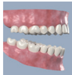
Die hochwertige, ästhetische und vollkeramische Brücke nach ihrer Eingliederung

• Auch in diesem Fall überbrückt ein Provisorium die Einheilzeit. Nach ihrem Ende finden die endgültigen Zahnkronen oder die Brücke auf den Implantaten ihre dauerhafte Position.