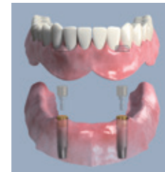
Zwei intraforaminale Implantate, die zur Aufnahme der Prothesenhaltelemente dienen, werden eingesetzt

Hierzu gibt es technisch hochentwickelte Haltesysteme aus zwei Teilen. Ein Teil wird auf die Implantate gesetzt, das entsprechende Gegenstück in die Zahnreihe eingearbeitet. Die Verbindungen wirken wie Druckknöpfe, die dem Zahnersatz festen Halt geben. Sie lässt sich, etwa zum Reinigen, immer wieder leicht lösen.