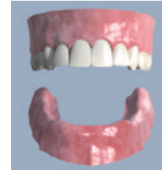
Vollständig zahnloser Unterkiefer

• Wenn die Zeit ihre Spuren hinterlassen hat und Sie im Lauf der Jahre alle Zähne im Unterkiefer verloren haben, auch dann ist Zahnersatz auf Implantaten eine überzeugende Wahl. Auf zwei bis vier Implantaten kann der neue Zahnersatz festen Halt finden. Der Oberkiefer bleibt dabei gaumenfrei.